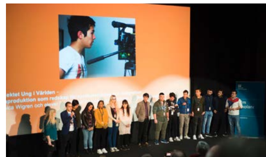
Här presenteras GOTLAND - Projektet Ung i världen på Film i skolan-dagarna 2017.