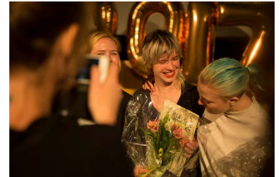
Kultur i Väst arrangerar Frame – en årlig kortfilmfestival, tävling och mötesplats.